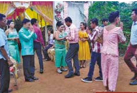
accueil des invités