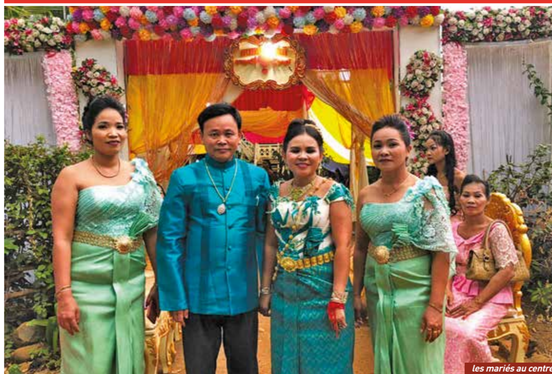
les mariés au centre

bulletin trimestriel - juin 2019 - N°143