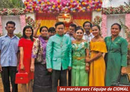
les mariés avec l'équipe de CIOMAL