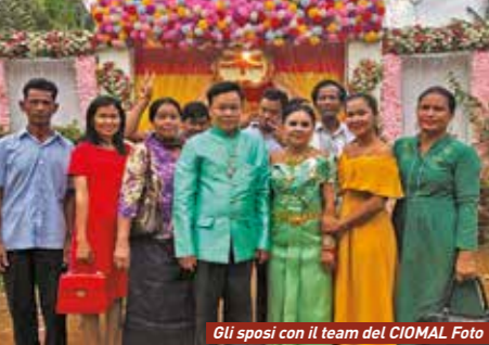
Gli sposi con il team del CIOMAL Foto