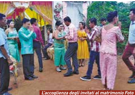
L'accoglienza degli invitati al matrimonio Foto