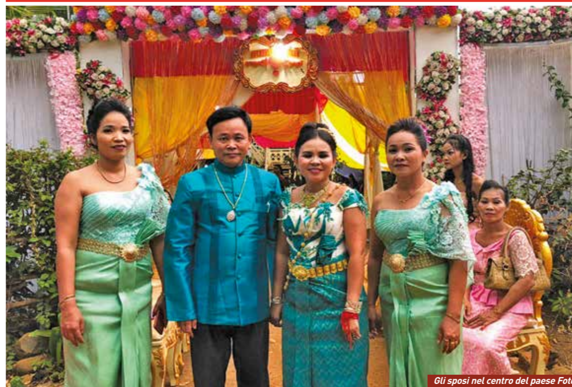
Gli sposi nel centro del paese Foto

bolletino trimestriale - giugno 2019 - N°143