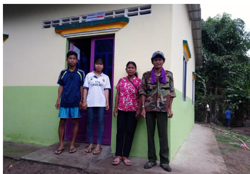
Maison après rénovation

Les bourses d'études, soutenues en partie par la Fondation Peter Donders, sont attribuées à des jeunes atteints de la lèpre ou vivant dans une famille dont un membre souffre de cette maladie. Le CIOMAL essaye de soutenir les étudiants depuis leur prise en charge jusqu'à la fin de leur cursus. Une équipe se rend régulièrement auprès des bénéficiaires et les suit dans leur formation en restant en contact avec leurs familles et leurs professeurs. Les bourses permettent de financer l'achat de nourriture et matériel scolaire ou l'amélioration de logements.