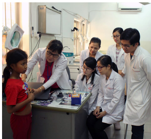
A gauche: Formation

Parmi les activités plus récréatives, le karaoké, le théâtre ou les jeux de société sont souvent proposés. Chaque année, les patients de KKLRC participent également à différents événements sociaux organisés par le gouvernement tels que la Journée Internationale des Personnes Handicapées, des concours de chant pour les personnes handicapées et d'autres événements à l'intention des handicapés.