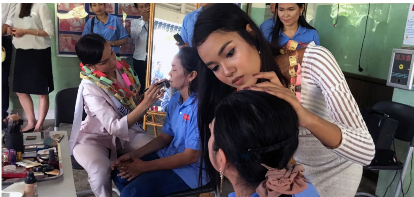
Miss Cambodge: atelier de maquillage pour les patientes atteintes de la lèpre

E n juillet 2018, KKLRC a accueilli 4 Miss Cambodge 2017 en ses murs. Elles ont échangé et prodigué quelques conseils de maquillage avec des patientes atteintes de la lèpre. L'événement avait pour objectif de sensibiliser le grand public, mais il a également offert l'occasion aux patients, à l'équipe du CIOMAL et au public présent de rencontrer les beautés khmères et d'échanger sur la lèpre. Plus de 100 personnes et 5 journalistes étaient présents.