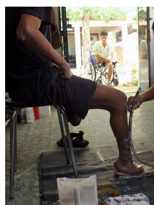
A gauche: Journée mondiale de la lèpre Au centre: Sensibilisation A droite: Chaussures orthopé- diques