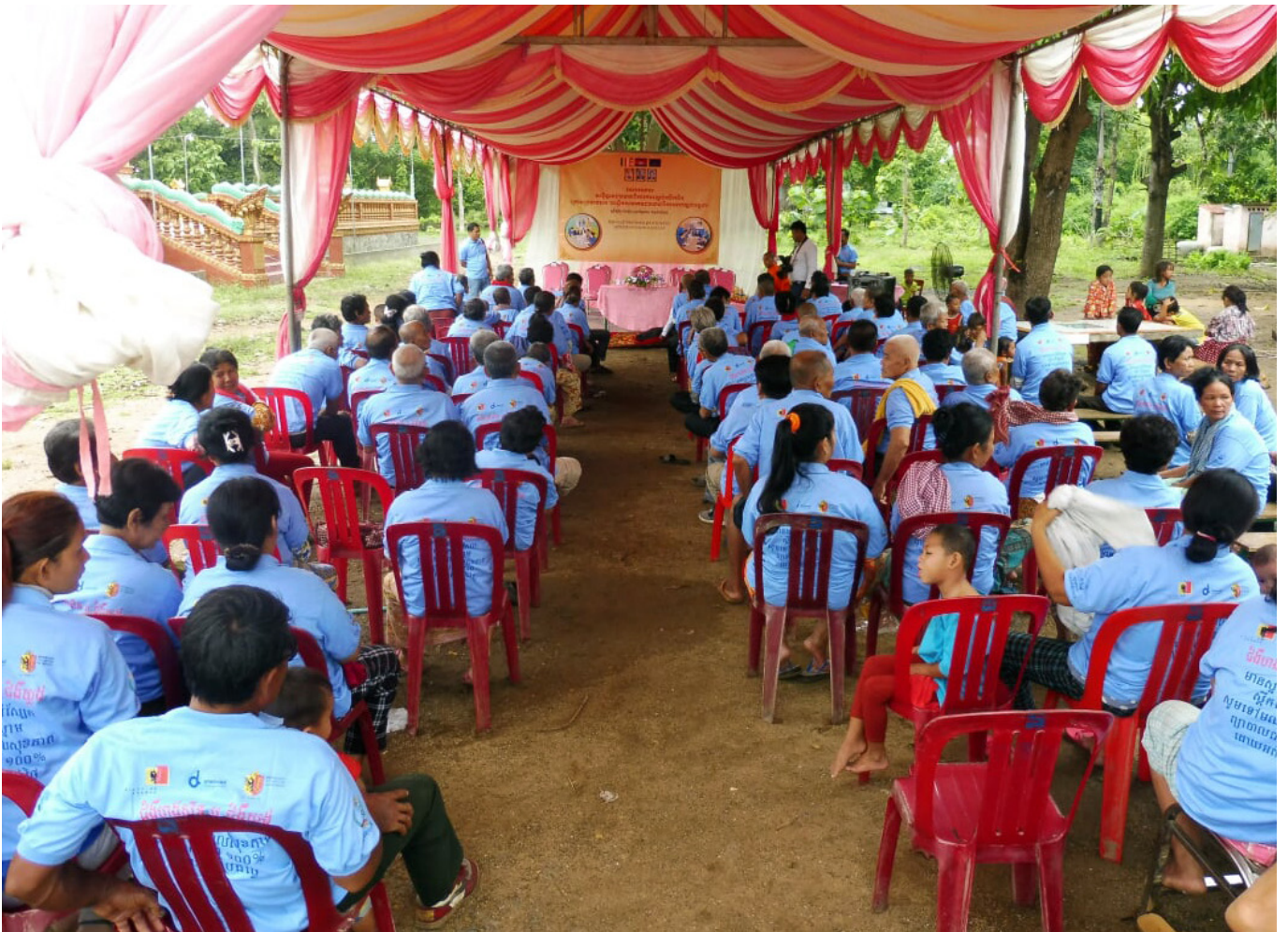
Association des personnes atteintes de la lèpre.