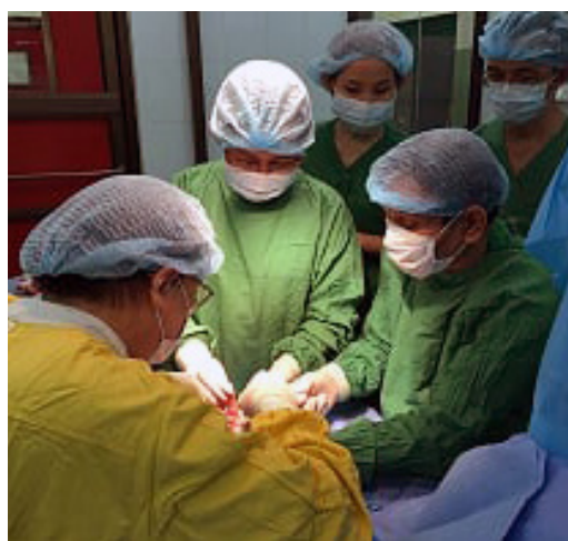
A gauche: Kien Khleang, centre de soins médicaux A droite: Opération de chirurgie

207 personnes ont bénéficié de physiothérapie. 191 personnes ont reçu du matériel de rééducation: lunettes de soleil, gants de protection, attelles, béquilles, chaussures adaptées et de protection etc.