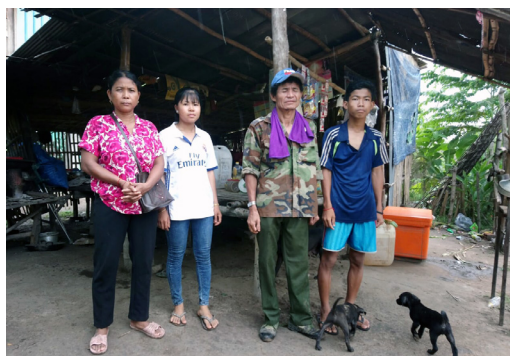
Maison avant rénovation

Pour recevoir un soutien, le bénéficiaire doit remplir un formulaire de demande, qui est soumis à une évaluation ; l'équipe se rend alors chez la personne pour déterminer son niveau de vie et son éligibilité. Puis les dossiers sont soumis à un Conseil interne qui statue sur la demande. Un contrat est ensuite signé avec le bénéficiaire. Les personnes les plus démunies et qui remplissent toutes les conditions sont sélectionnées en premier. Une formation obligatoire est organisée avant l'attribution du prêt. Les prêts sont de 150 USD sur 1 an ou de 300 USD sur 2 ans, selon l'importance et la durée de la mise en place de l'activité économique présentée par le futur bénéficiaire: élevage de cochons, de poules ou de vaches, petite entreprise, agriculture. Les bénéficiaires sont informés que le remboursement de leur prêt permettra à une autre personne de bénéficier d'une aide.