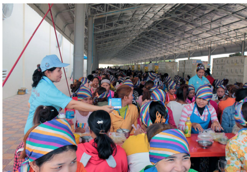
Campagne de sensibilisation dans les usines textiles

D es actions de sensibilisation ont été menées dans 6 usines textiles dans les semaines précédant le nouvel an khmer en avril 2018, ainsi que dans 6 autres usines textiles avant les fêtes de Pchum Ben en octobre 2018. 56'610 employées ont participé à ces campagnes. Des brochures et des posters décrivant les signes et les symptômes de la lèpre ont été distribués dans chacune de ces douze usines. Durant ces activités, l'équipe du CIOMAL a accompagné des représentants du Ministère des Affaires sociales, des vétérans et de la réhabilitation des jeunes (MoSVY) ainsi que du Ministère de la Santé (MoH)/NLEP.