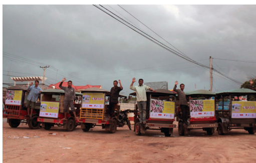
Campagne d'information sur les touktouks

De plus, les équipes du CIOMAL ont affiché 171 posters sur des touktouks dans ces mêmes provinces dans le but de renforcer l'information sur la lèpre dans les campagnes.