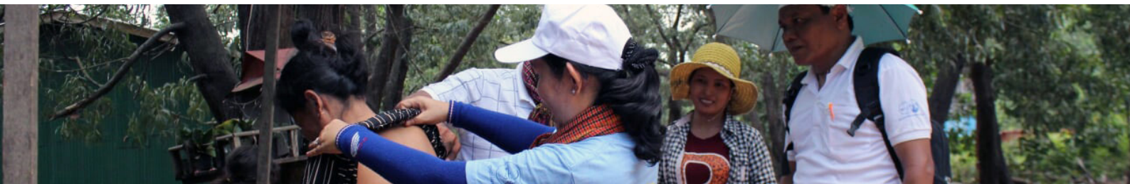
Campagne de détection précoce de la maladie

La détection active se distingue par une recherche de nouveaux cas de lèpre. Le Programme National d'Élimination de la Lèpre (NLEP), dans ses activités de routine, a la responsabilité de faire ce suivi, de dépister les nouveaux cas et de recenser les malades. Seuls les superviseurs nationaux peuvent donner un diagnostic, mais sous-rémunérés, ils ne sont pas motivés à faire leur travail et manquent de compétences. En moyenne, par ce biais, on recensait 300 à 400 nouveaux cas par an ; or depuis 2009 les chiffres ont baissé à 249. C'est un bilan négatif, car il révèle que les superviseurs nationaux, en partie à cause du manque de moyens et de formation, n'accomplissent pas leurs tâches de manière fiable.