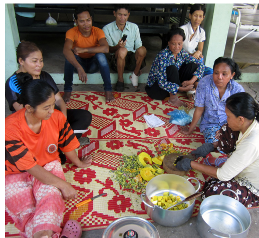
A droite: Cours de cuisine