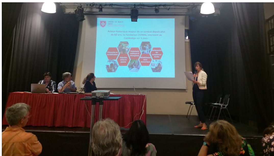
Assemblée Générale 2019 de la FGC.

L e 27 juin, la Fondation CIOMAL a adhéré à la Fédération Genevoise de Coopération (FGC) et à sa déclaration de principes en matière de solidarité internationale : cette adhésion permet au CIOMAL d'interagir avec les partenaires de la FGC et de bénéficier de son label pour le financement de projets de développement durable axés sur le transfert de compétences et la formation des acteurs locaux.