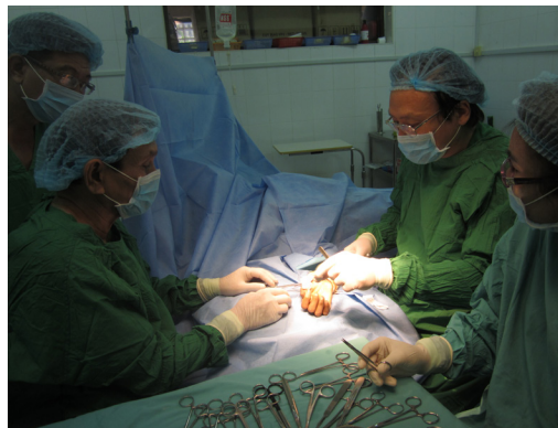
A gauche: Kien Khleang, centre de soins médicaux A droite: Opération de chirurgie.