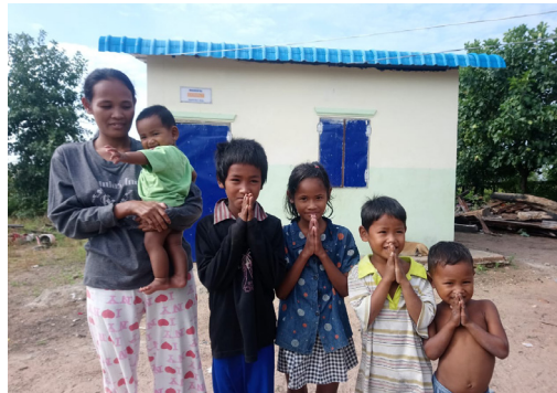
Maison après rénovation.

Le projet SER répond aux besoins spécifiques des personnes atteintes de lèpre en encourageant et en soutenant leur réintégration dans la société, en fournissant un toit si nécessaire, un soutien financier pour démarrer une entreprise ou un parrainage pour l'éducation.