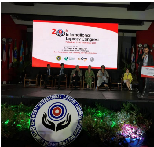
XX ème Congrès international de la lèpre, à Manille.

Les aspects diagnostiques, thérapeutiques, épidémiologiques et psychosociaux étaient au centre des quelque cent conférences présentées à cette occasion. Même si le déclin de la lèpre continue, il reste beaucoup à faire. La stigmatisation et le manque d'informations entravent l'éradication totale de la maladie.