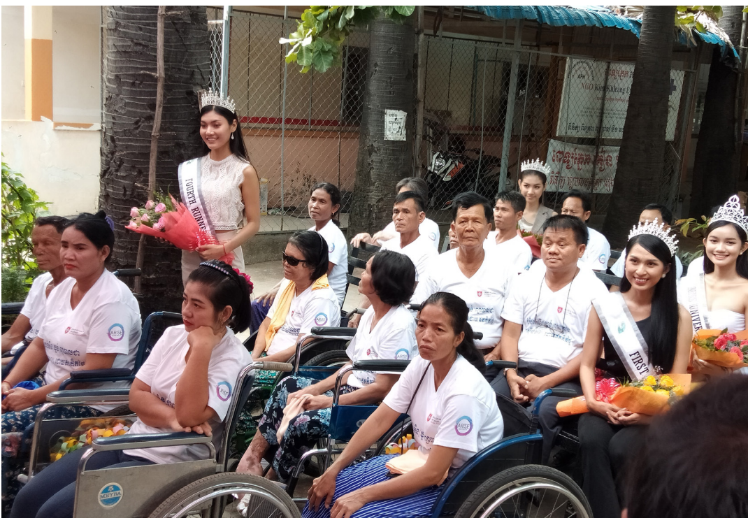
Interaction entre Miss Cambodge 2019 et ses dauphines avec les malades de la lèpre.

Le but de cet événement annuel est de sensibiliser à la lèpre; la présence de ces demoiselles a abouti sur le tournage d'un court reportage de la chaîne de télévision PNN.