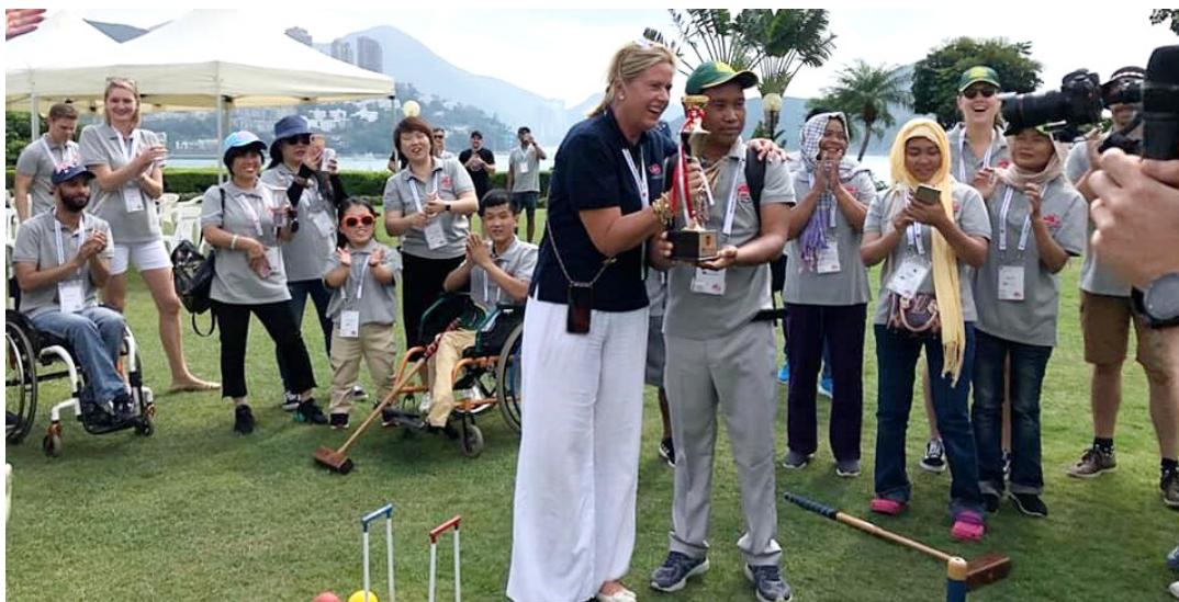
Remise de la « Christopher Cup » lors du III ème camp Asie-Pacifique de l'Ordre de Malte pour jeunes handicapés, à Hong Kong.