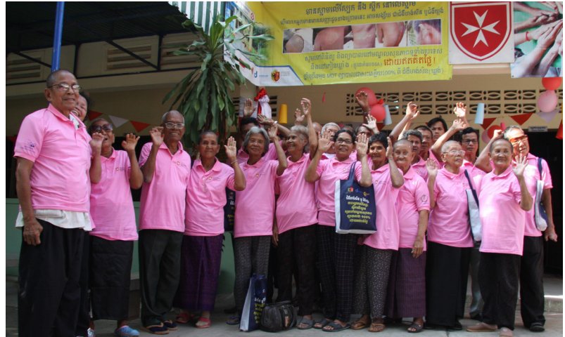
Journée mondiale de lutte contre la lèpre

Environ 200 personnes ont assisté à l'événement. Trois Miss Cambodge sont venues à KKLRC et ont défilé. Ensuite, tout le monde a pu danser et profiter de cette journée inoubliable.