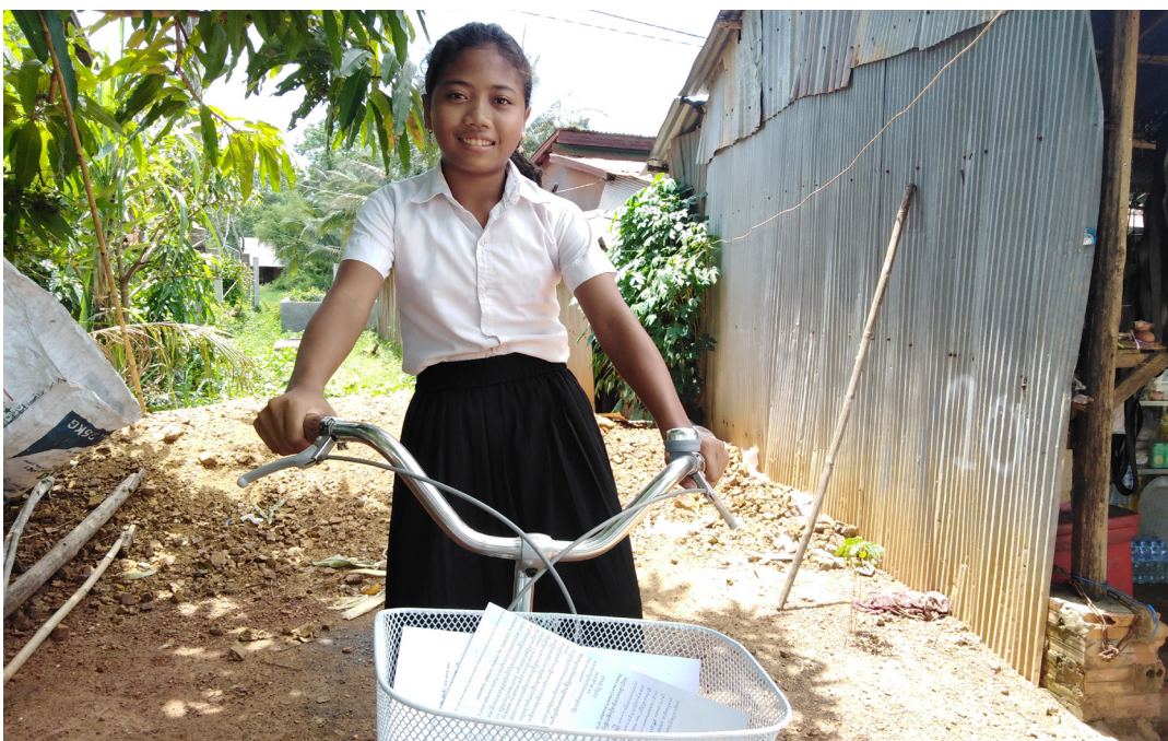
Etudiante bénéficiant d'une bourse d'étude.

En 2019, la Fondation Peter Donders a apporté son soutien à des bourses et à la rénovation de maisons, appuyée par le Compounding Partnership Fund . Les bourses sont réservées aux jeunes atteints de lèpre ou à ceux qui vivent dans une famille dont l'un des membres souffre de la lèpre. La Fondation CIOMAL essaie de soutenir les étudiants jusqu'à la fin de leurs études. Dans ce projet, un suivi étroit est essentiel. L'équipe rend régulièrement visite aux bénéficiaires et les suit tout en restant en contact avec eux, leurs familles et leurs enseignants. Des bourses d'étude sont accordées aux étudiants pour acheter le matériel scolaire, prendre en charge leur hébergement et se nourrir.