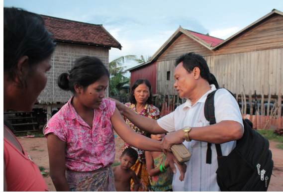
Campagne de détection précoce de la maladie.

Le projet initial de « Contact Tracing » a été mis en œuvre dès 2011 par la Fondation CIOMAL, avec le soutien de la Fondation Novartis, du Netherland Leprosy Relief, de la Fondation Raoul Follereau et de l'Ordre de Malte France. Il consiste à détecter précocement de nouveaux cas déclarés de lèpre : à cette fin, l'équipe du CIOMAL se rend conjointement avec des employés du Programme national auprès d'anciens patients afin de dépister dans leur entourage (famille et voisins) des nouveaux cas de lèpre et de les traiter le plus rapidement possible pour éviter une propagation du bacille à des personnes saines. Ces campagnes ont débuté dans les districts ayant la plus grande prévalence de personnes atteintes par la lèpre. Entre 2011 et juin 2015, plus de 600 nouveaux cas ont été identifiés, puis soignés. Les données récoltées lors de ce premier cycle ont permis de définir le périmètre d'action du cycle suivant (entamé en 2017) et d'obtenir des statistiques fiables sur la situation de la lèpre dans le pays.