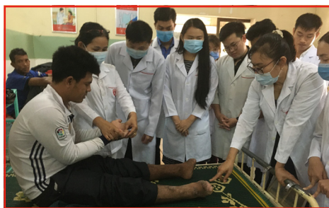
Formation du personnel médical .

ment mettre en place des projets urgents, comme la construction de maisons ou plus simplement de toilettes ainsi que d'apporter un soutien économique à travers des bourses d'études, par exemple.