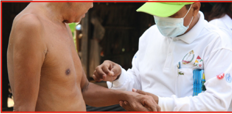
Campagne de détection.

Durant les cinq campagnes de détections menées au Cambodge en 2020, 13 nouveaux cas de lèpre ont été détectés.